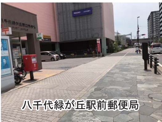
八千代緑が丘駅前郵便局

「八千代緑が丘駅の郵便局前の歩道に車が駐車する。子どもが危ない。何とかできないか」とのアンケートへ改善要望。